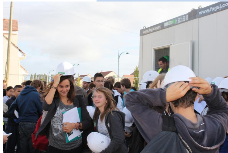
Chantier TBI-SHAM aux Essarts-Le-Roi